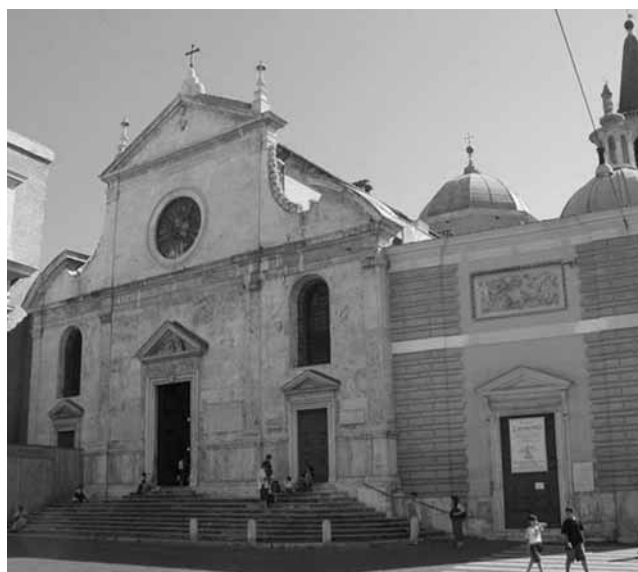
Santa Maria del Popolo - Roma