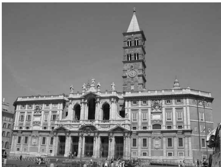
Basilica di Santa Maria Maggiore - Roma