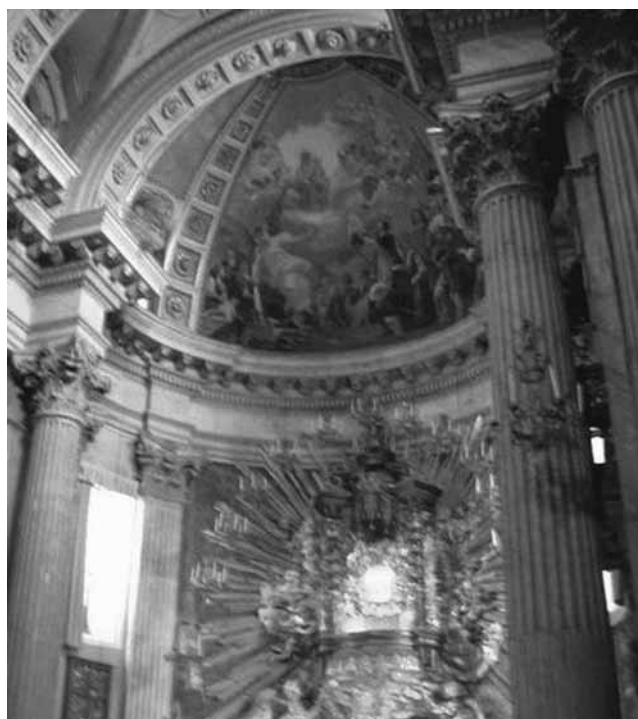
Santa Maria in Portico in Campitelli - abside