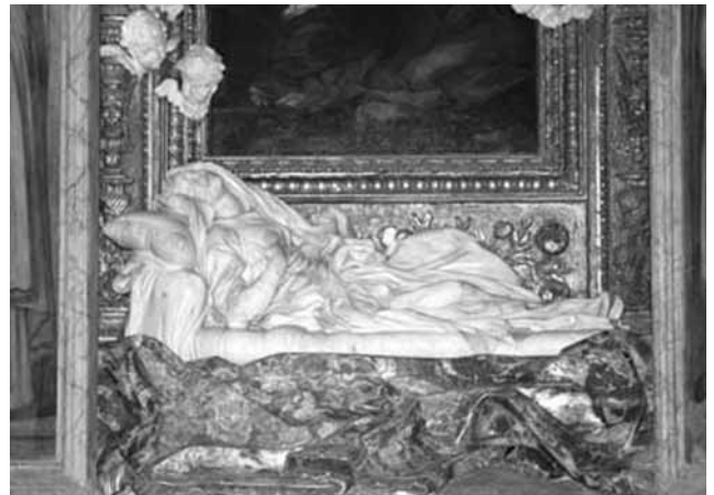
Gian Lorenzo Bernini - Estasi di Beata Ludovica Albertoni