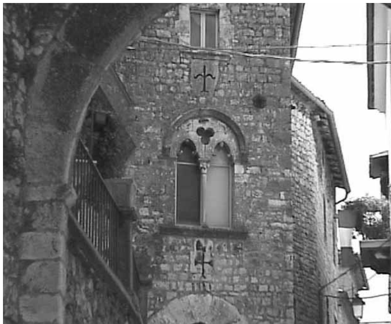
Scorcio di Veroli (FR)

Assessore alla Cultura, Spettacolo e Sport Regione Lazio