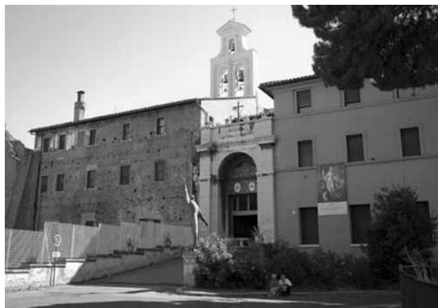
Santi Cosma e Damiano - Roma

La chiesa risale al 527 quando Papa Felice IV la fece ricavare in un'ala del Foro della Pace, facente parte del complesso del Foro Romano. Fu rinnovata nel 1632 su disegno dell'Arrigucci. L'interno a una navata con cappelle laterali, corrisponde alla cella dell'edificio pagano; nel soffitto dove sono effigiati gli stemmi di Papa Urbano VIII campeggia la "Gloria dei Santi Cosma e Damiano" di M. Tullio Montagna. Notevoli per la pregevole fattura i mosaici del VI sec. dell'abside, sull'arco trionfale e in particolare quelli del catino dove è rappresentato Felice IV nell'atto di presentare il modello della chiesa a Cristo tra i santi Pietro, Paolo, Cosma e Damiano e Teodoro. Al di sotto una fascia dove è rappresentata una processione di pecore verso l'Agnello, Cristo sul Monte del Paradiso e un'iscrizione di Felice IV. Sull'altare l'immagine della Madonna di S. Gregorio del 1200 e a sinistra un pregevole candelabro cosmatesco per il cero pasquale. Nella prima cappella di destra un affresco di datazione incerta, forse del XIII sec., raffigura Cristo in Croce; nella seconda cappella di sinistra affreschi dell'Allegrini eseguiti verso la metà del '600. Nel sottostante ambiente dell'antica basilica si conserva l'altare originale della chiesa costruito in marmo pavonazzetto.